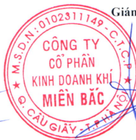
Đoàn Trúc Lâm