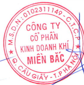
Đoàn Trúc Lâm