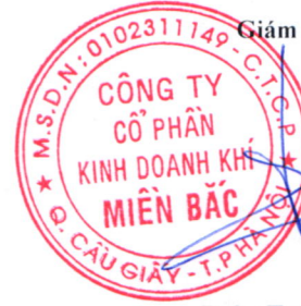
Đoàn Trúc Lâm